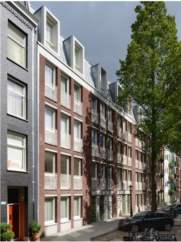
De nieuwe gevel is een eigentijdse vertaling van de oorspronkelijke panden