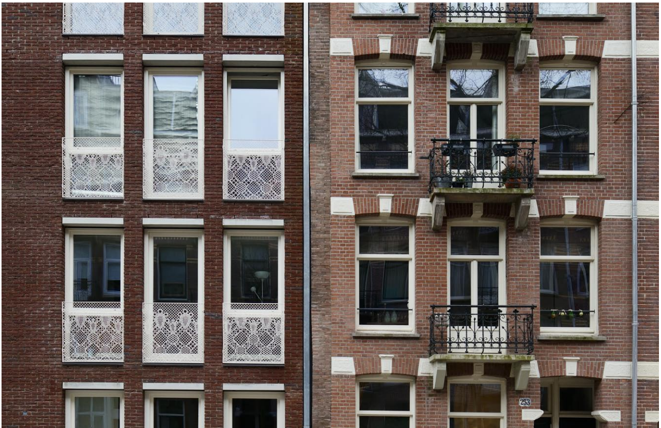
Gevelfragment oude en nieuwe gevel met kunsttoepassing hekwerken van De Makers Van