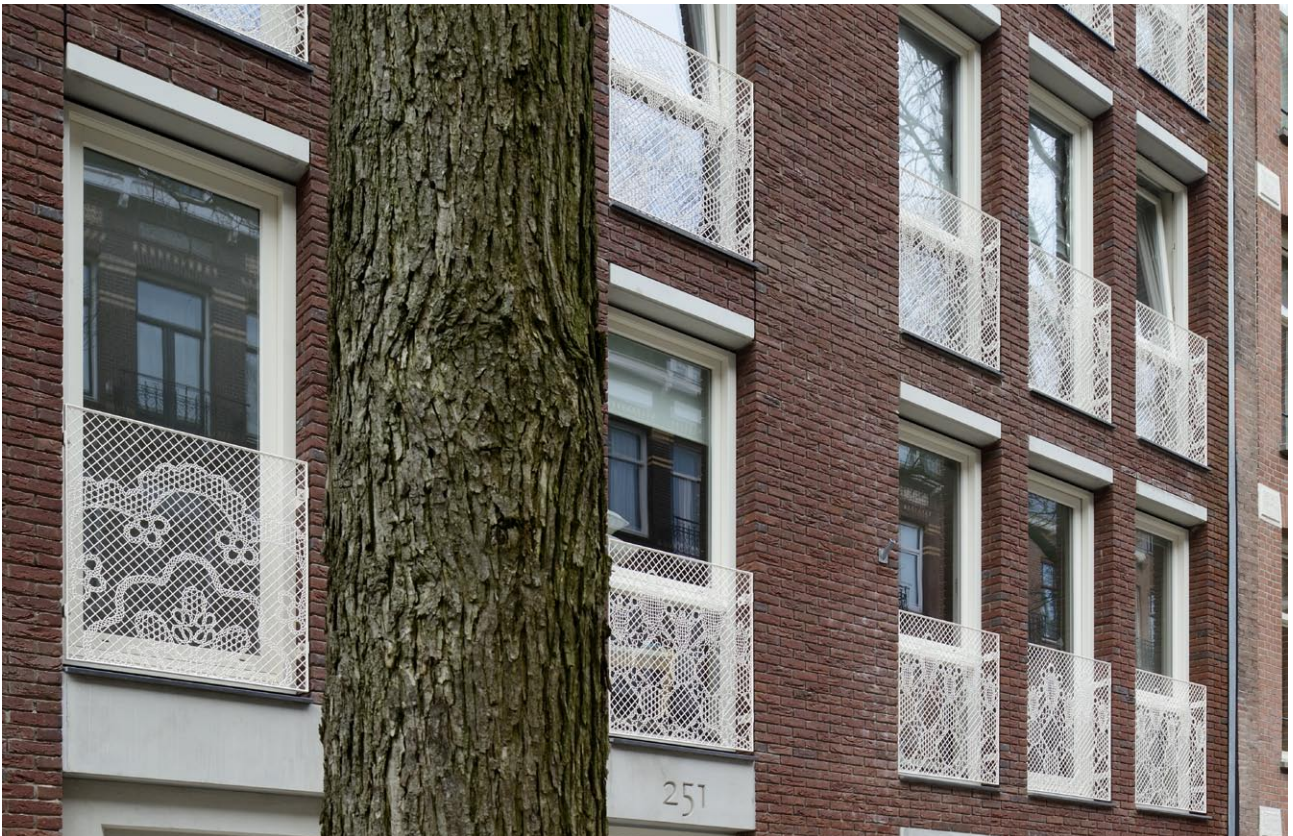
Gevelfragment met kunsttoepassing hekwerken van De Makers Van, elke woning heeft unieke hekwerken