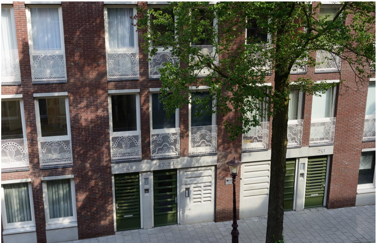
Fragment van de gevel met kunsttoepassing franse balkon hekwerken van De Makers Van