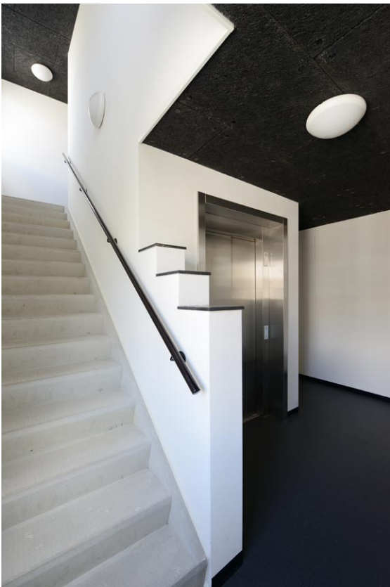
Entreehal met trap en lift