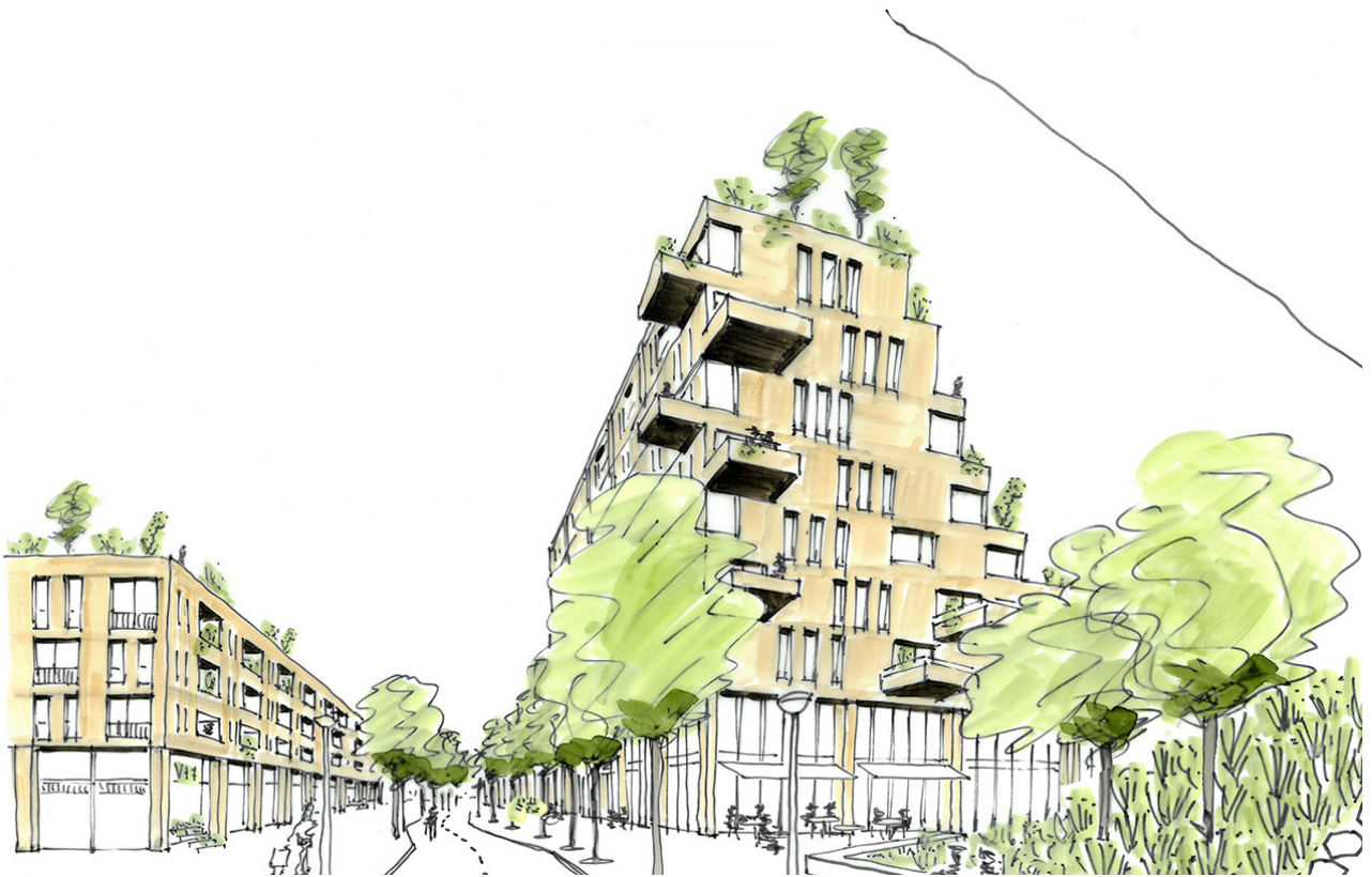
Schets de nieuwe bebouwing met de winkels op de begane grond en erboven komen de woningen, ter plaatse van de bestaande oost-west route met het fietspad.