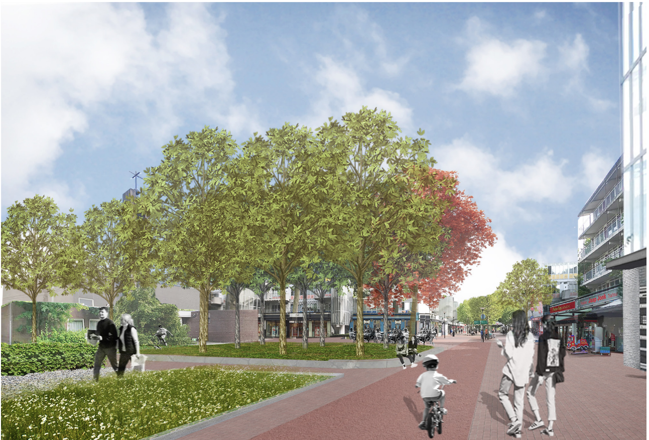
Impressie van het Kerkplein aan het noordelijke uiteinde van het winkelcentrum.