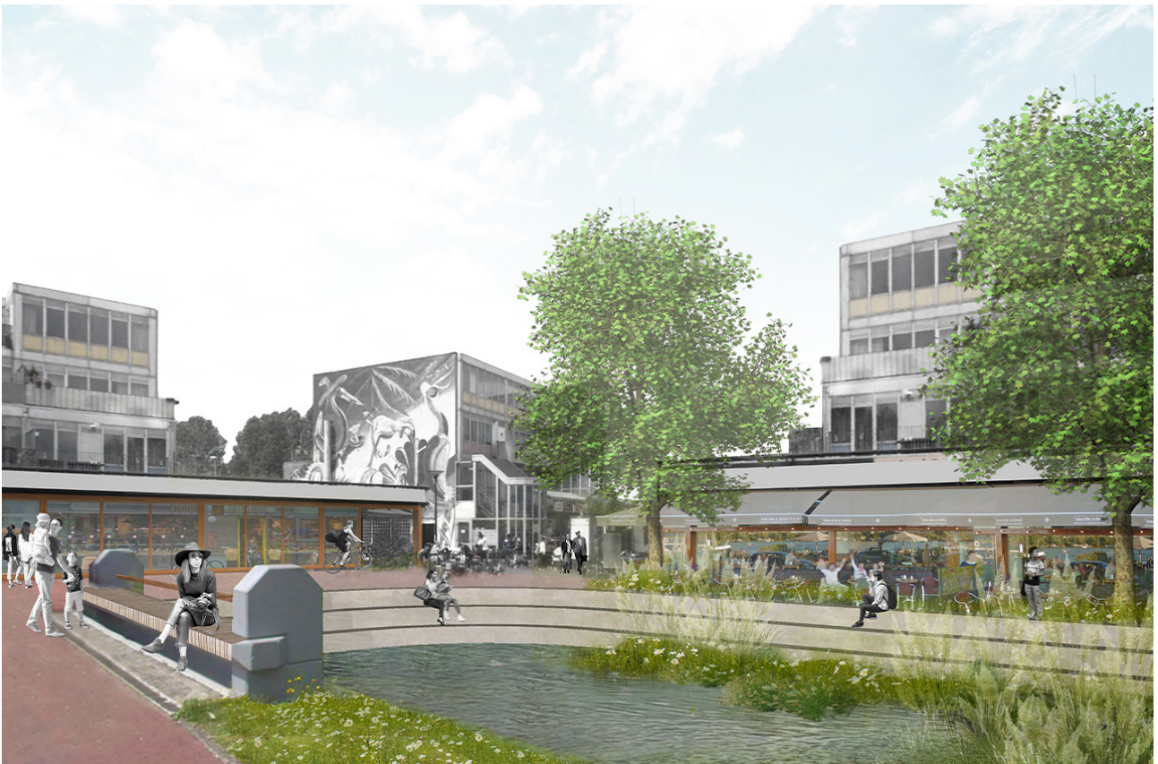
Winkelcentrum Reigersbos: het nieuwe centrum geeft een impuls aan de buurt. De bestaande watergang wordt gebruiksvriendelijk vormgegeven.