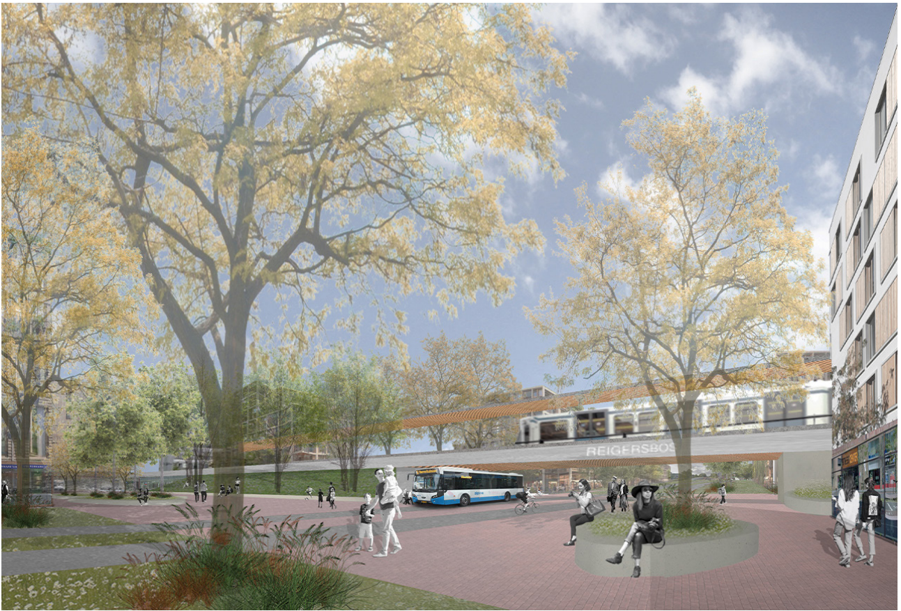
Voorstel voor de nieuwe verbinding ter plaatse van de dreef met verblijfskwaliteit en levendige plinten.