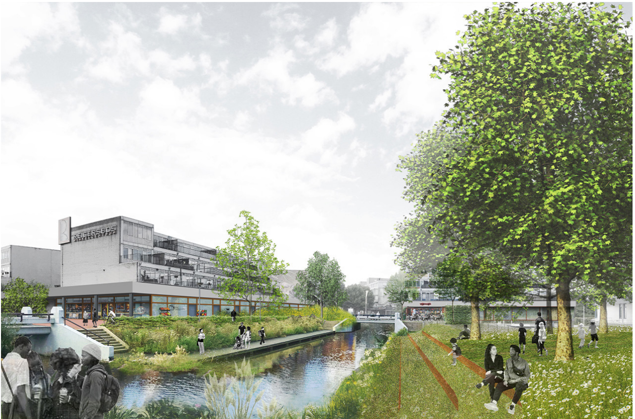
Transformeren van de leefomgeving: we maken een fijne, groene plek om elkaar te ontmoeten en om zo ook de sociale controle in de buurt te stimuleren. Dit wordt een klimaat adaptive groene verblijfsruimte waaraan de schoolgebouwen liggen aan de zuidkant van het winkelcentrum.